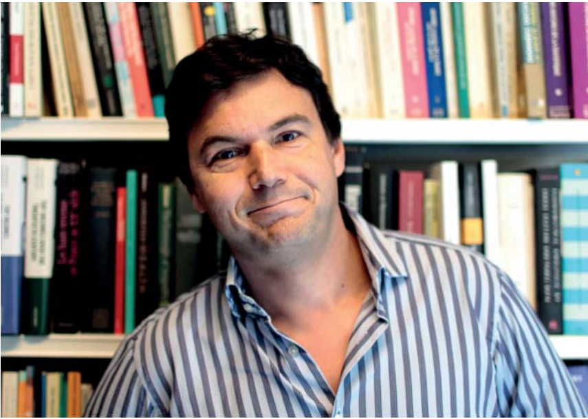
Thomas Piketty, a Capital i ideologia , considera que el suport a la independència radica de manera espectacular en les categories més afavorides.

«Sembla que escolta més els seus prejudicis que les dades, fins al punt d'inferir que els catalans no volem exercir la solidaritat amb altres territoris i només aspirem a esdevenir un paradís fiscal.»